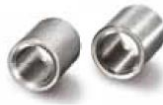
Schweißmuffen in Stahl oder Edelstahl