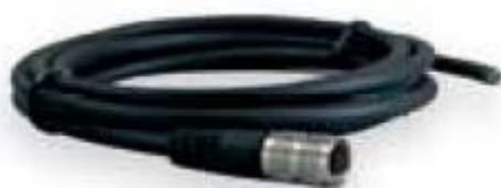
Geschirmte Anschlusskabel in verschiedenen Längen erhältlich