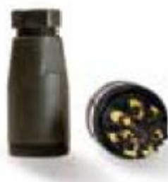
Kupplungsdose mit Schraubanschluss